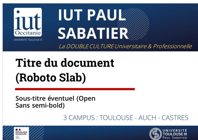
1 re de couverture