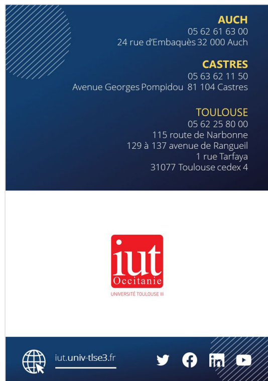
4 e de couverture