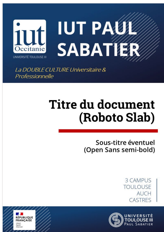
1 re de couverture