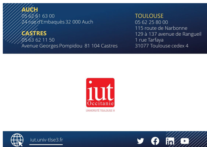
4 e de couverture

Typos préconisées à utiliser pour vos projets pour les pages intérieures : Titres : Roboto slab / Sous-titres : Open Sans SemiBold Contenu : Open Sans light