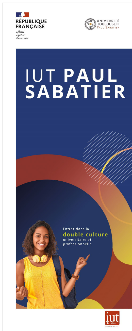
Roll-up décliné de la plaquette institutionnelle de l'IUT

NB : la charte de ces kakémonos ne prévoit pas d'ajout d'images supplémentaires, seulement des zones de texte aux positionnements indiqués dans les modèles de document. Merci de vous conformer à cette charte.